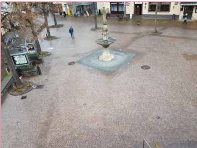
Der renovierte Platz – ansehnlich, pflegeleicht und unfallfrei The renovated square – attractive, easy to clean and accident free