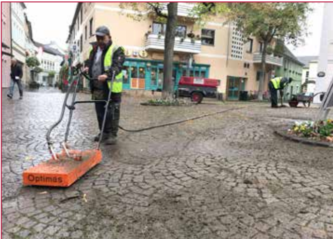
Reinigung der Altfugen mit der „Fugenhexe“ der Firma OPTIMAS und Hochdruckwasserstrahl auf mind. ½ Steinhöhe | Cleaning the old joints using „Fugenhexe“ by OPTIMAS and high pressure water jet to at least ½ stone height