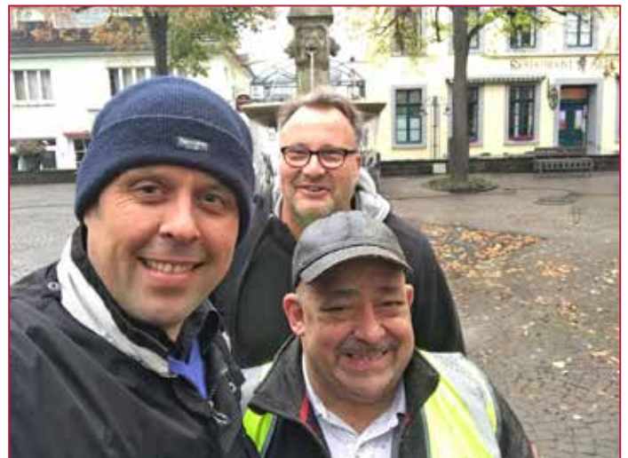
Das ROMEX® - Team mit SERVICE-PARTNER The ROMEX® - Team with SERVICE-PARTNER