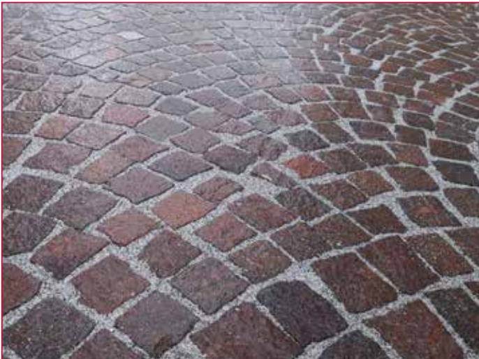
Verfugung mit 7 kg/m 2 ROMPOX®-D2000, der moderne Pflasterfugenmörtel, Farbe: steingrau Jointing with 7 kg/m 2 of ROMPOX®-D2000, the modern paving joint mortar, colour: stonegrey