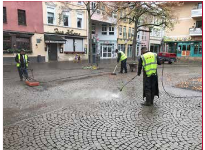
Für die Reinigungsarbeiten wurden rund 48 Stunden mit 3 Arbeitern benötigt Around 48 hours and 3 workers were required to carry out the cleaning work